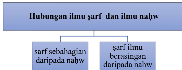
Diagram 3: Aliran pendapat ilmuwan bahasa Arab terdahulu berkaitan hubungan ilmu ṣarf dan ilmu naḥw